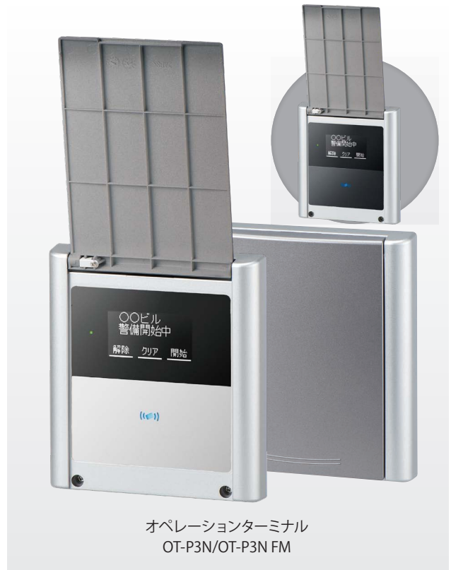
オペレーションターミナル OT-P3N/OT-P3N FM