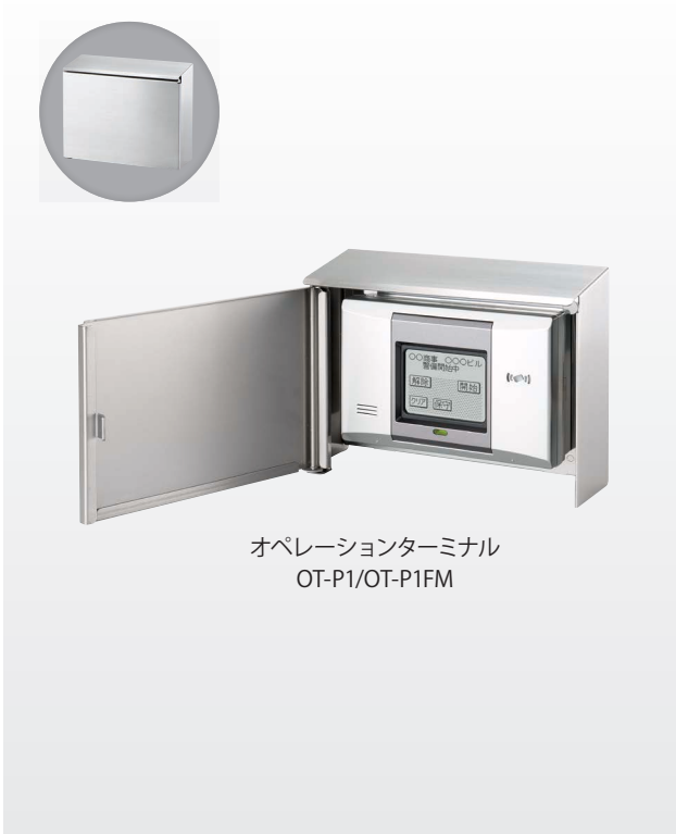
オペレーションターミナル OT-P1/OT-P1FM