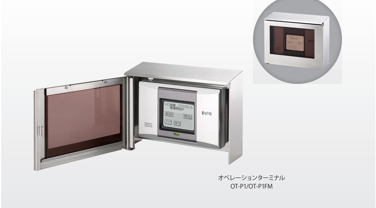
オペレーションターミナル OT-P1/OT-P1FM